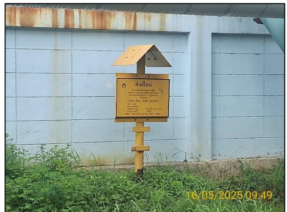
รูปที่ 2.2-1 ป้ายแสดงตำแหน่งแนวท่อก๊าซธรรมชาติ