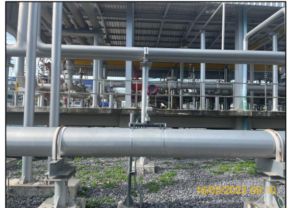
รูปที่ 2.2-5 Gas Detector