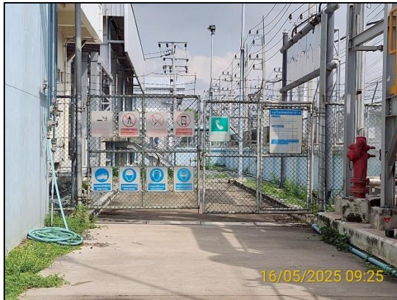
รูปที่ 2.2-4 ป้ายเตือนด้านความปลอดภัย